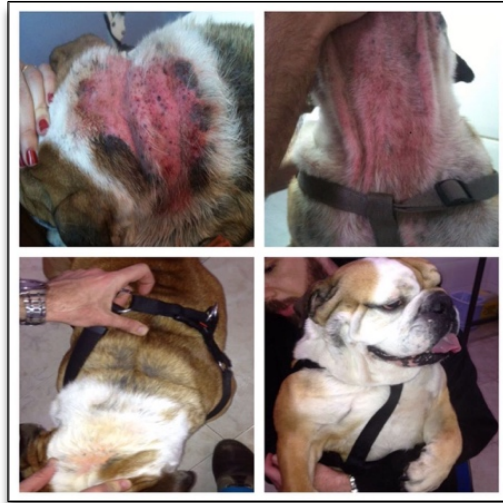
Sarna demodécica con pioderma profunda

Lugar: AMHB. C. Aragó, 186, 2º 1ª. Barcelona